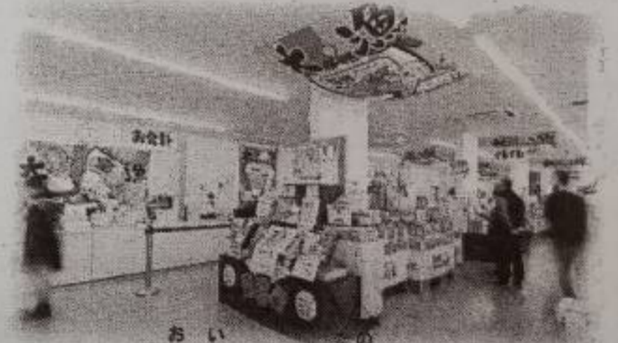
おい しみ したの 美味しさと楽しさのテーマパーク かいせん しょうが ま 海鮮せんべい塩釜

しょうが まは っ ちゃく マリンゲート塩釜発着 か き ふね しょうが まわ ない 貸し切りの船での塩釜湾内クルージング！