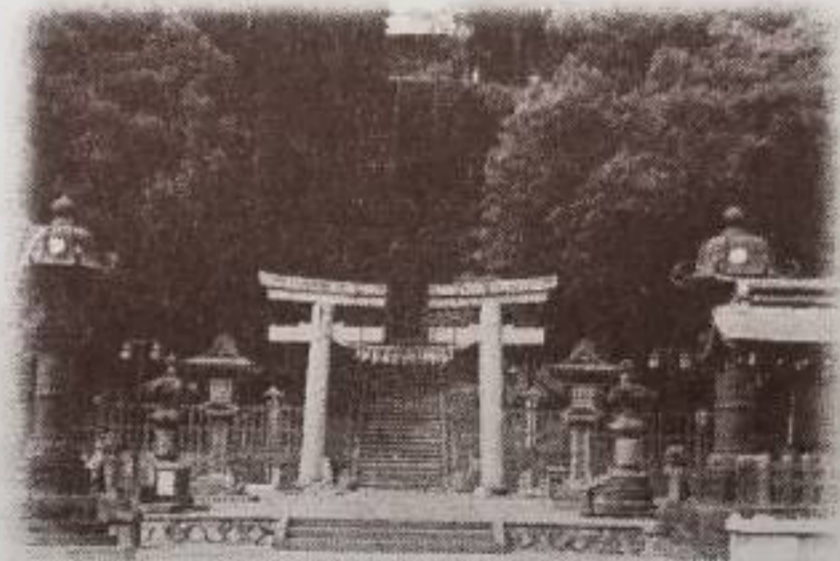
ねんいじょう れきし 1200年以上の歴史 しばひ こじんじゃ しょうが まじんじゃ 志波彦神社・鹽竈神社

しょうが まは っ ちゃく マリンゲート塩釜発着 か き ふね しょうが まわ ない 貸し切りの船での塩釜湾内クルージング！