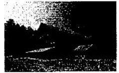
四階倉庫【国指定重要文化財】