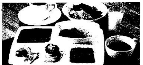
昼食は、小岩井の恵みプレート！(予定)

小岩井低温殺菌牛乳、農場産牛肉のシチュー、農場産牛肉のグリル、ミルク醸製乳工場のハロウミチーズなど農場の美味しさが、この一皿に！