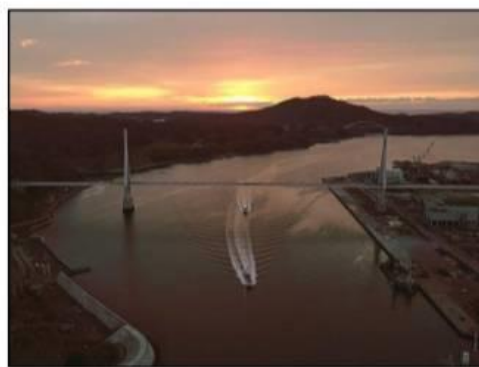
れいわ ねん がつ にち けせんぬまわん せうだんきょう 令和3年3月6日に気仙沼湾横断橋が 開通しました！