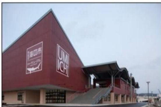
けせん ぬまの いち かいさんばつ ほんばいじょ いんしょくてん 気仙沼海の市！海産物の販売所や飲食店 があります！

いっしょに しゃしん しゃしん たの ぜひ一緒に写真やスケッチを楽しんでみませんか？